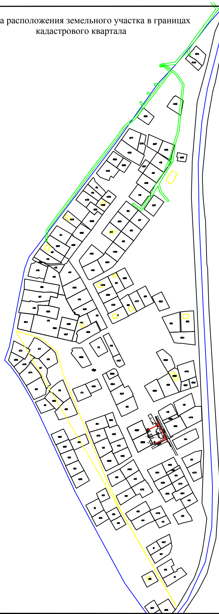
Схема расположения земельного участка в границах кадастрового квартала